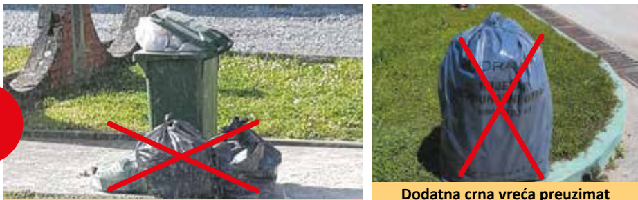
Vreće bez oznake Drava Kom-a